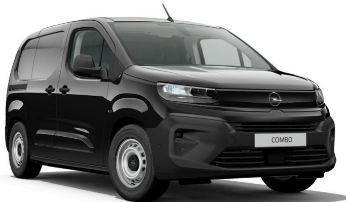
BLACK PERLA NERA

Ražotājs patur tiesības veikt izmaiņas cenās, tehniskajos datos un aprīkojumā. Rūpnīcā uzstādītais aprīkojums var ietekmēt CO 2 emisijas.