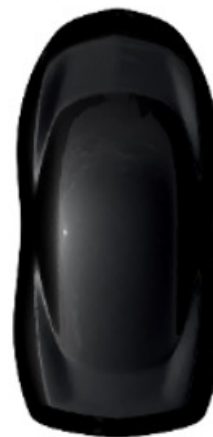
Black Perla nera