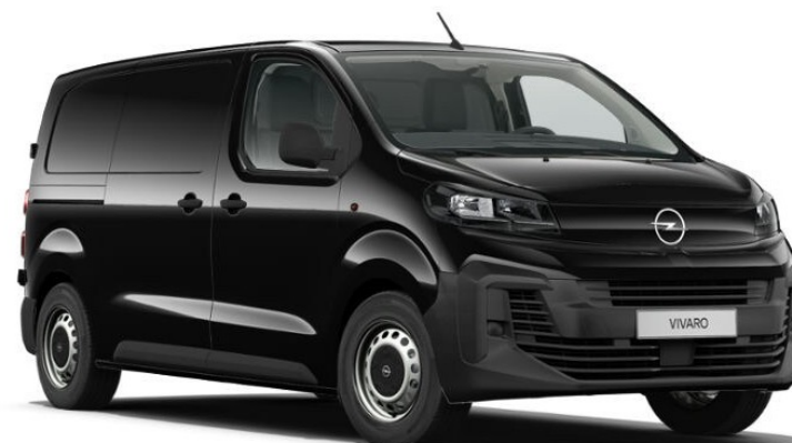
BLACK PERLA NERA

Ražotājs patur tiesības veikt izmaiņas cenās, tehniskajos datos un aprīkojumā. Rūpnīcā uzstādītais aprīkojums var ietekmēt CO 2 emisijas.